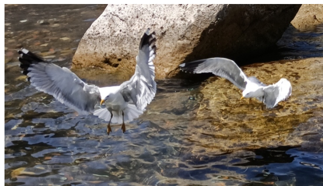
Danse de mouettes en Sicile